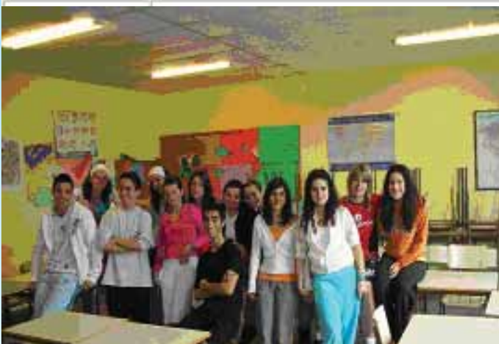
Alumnado 3ºD plurilingüe